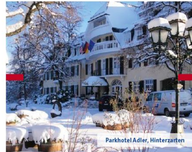
Parkhotel Adler, Hinterzarten