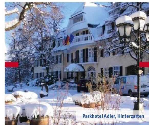
Parkhotel Adler, Hinterzarten